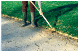
Binage des bordures d'allées