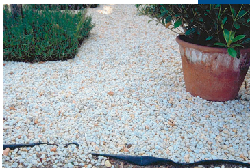
Géotextile sous les gravillons