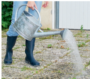
Le désherbage à l'eau bouillante : sûr et efficace