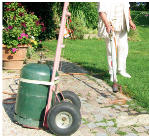
Désherbage au gaz